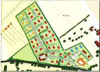
Stedenbouwkundig voorstel / rekenmodel 2012