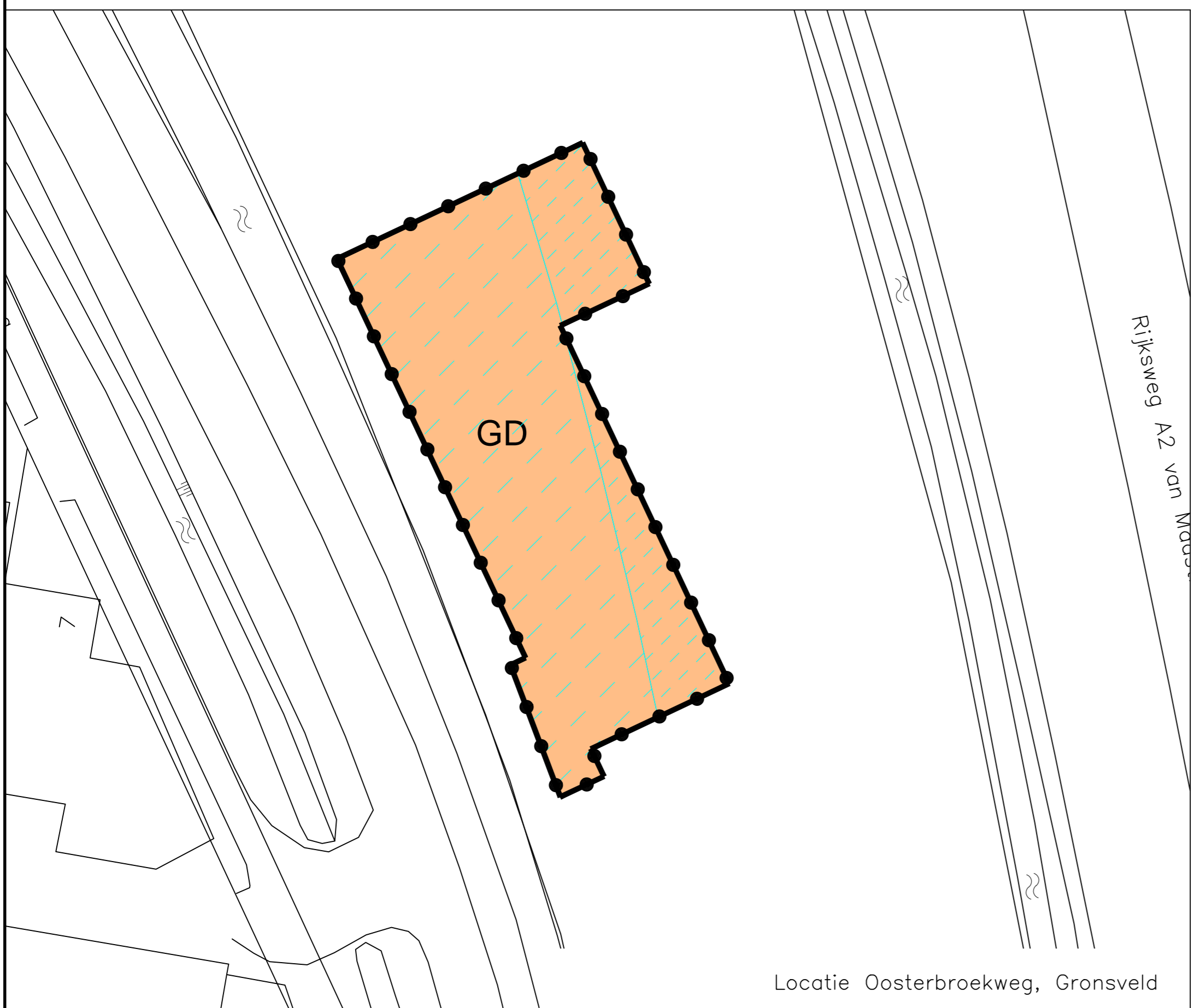
Locatie Oosterbroekweg, Gronsveld