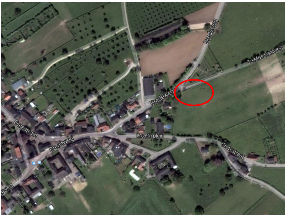
Ligging plangebied